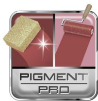
PIGMENT PRO technológia

A Dulux A Nagyvilág Színei a Pigment Pro egyedülálló technológiáján alapuló, beltéri, matt, latex emulzió. A csúcsmínőségű pigmentek optimális koncentrációja kivételes fedőképességet, tartós színeket és mosásállóságot biztosít.